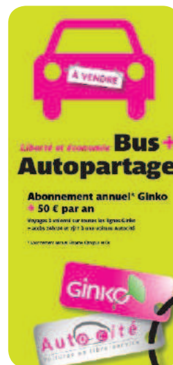
Campagne de communication du tarif combiné AutoCité-Ginko